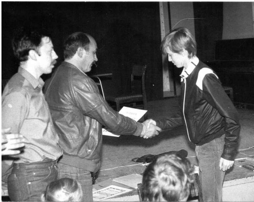
1985/86 Olsztyn Zakończenie pierwszej edycji Szachowej Ligi Szkolnej